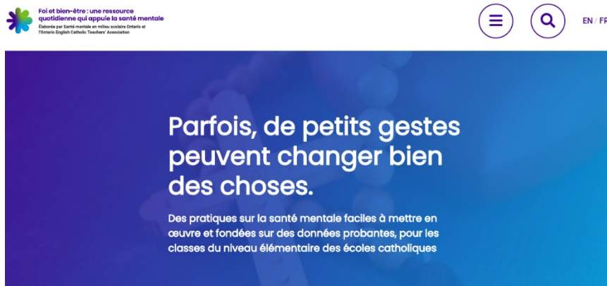
Illustration 1 : Foi et bien-être : une ressource quotidienne qui appuie la santé mentale